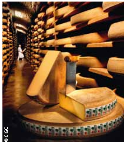
Le Comté n'aura plus de secret pour vous !